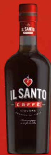
IL SANTO CAFFÈ 6 x 0,7l Glasflasche