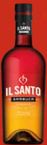
IL SANTO SAMBUCA 6 x 0,7l Glasflasche